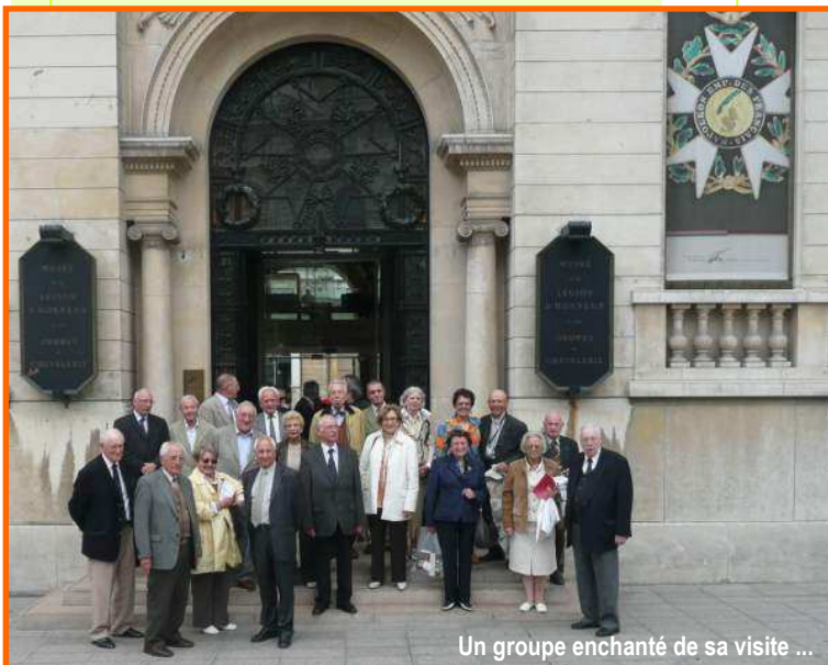
Un groupe enchanté de sa visite ...