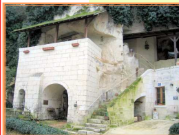
Turquant (Maine et Loire)

Des activités diverses devraient satisfaire les participants puisqu'une navigation commentée nous emmènera sur la Loire durant une petite heure et demie tandis qu'un bon repas fera échec à l'air du large qui, comme chacun sait, creuse ... Une promenade digestive nous permettra ensuite de visiter le village troglodyte de Turquant, avant qu'un bref détour sur le chemin du retour nous dépose dans une cave où nous pourrons faire quelques provisions ... Sous le soleil, bien sûr!