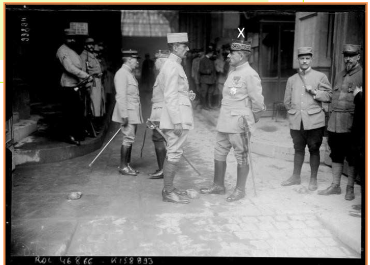
Le Général DUBAIL (X)

Il meurt à Paris le 7 janvier 1934. Il est inhumé au cimetière Montparnasse à Paris. Une avenue du 16 e arrondissement de Paris a été nommée en son honneur, l'avenue du Général-Dubail.